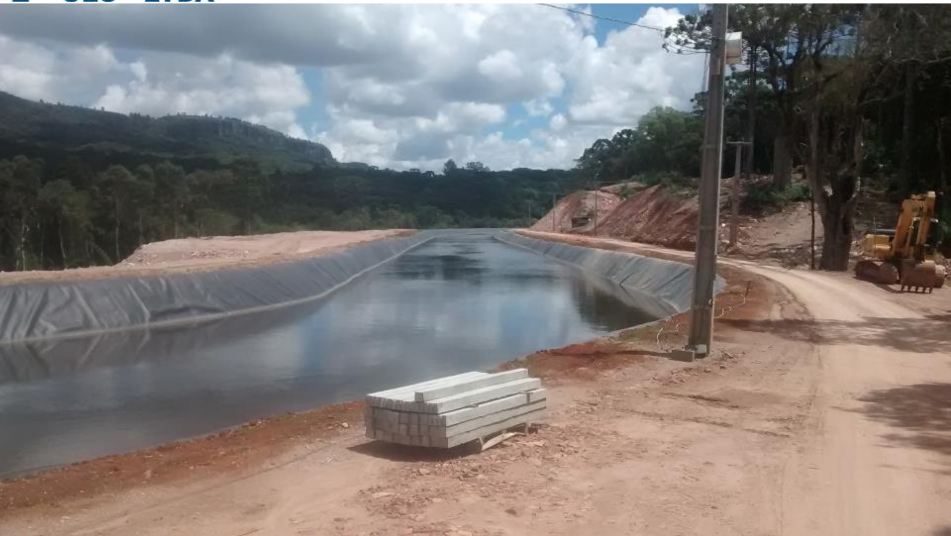
CANAL ADUTOR CHEIO