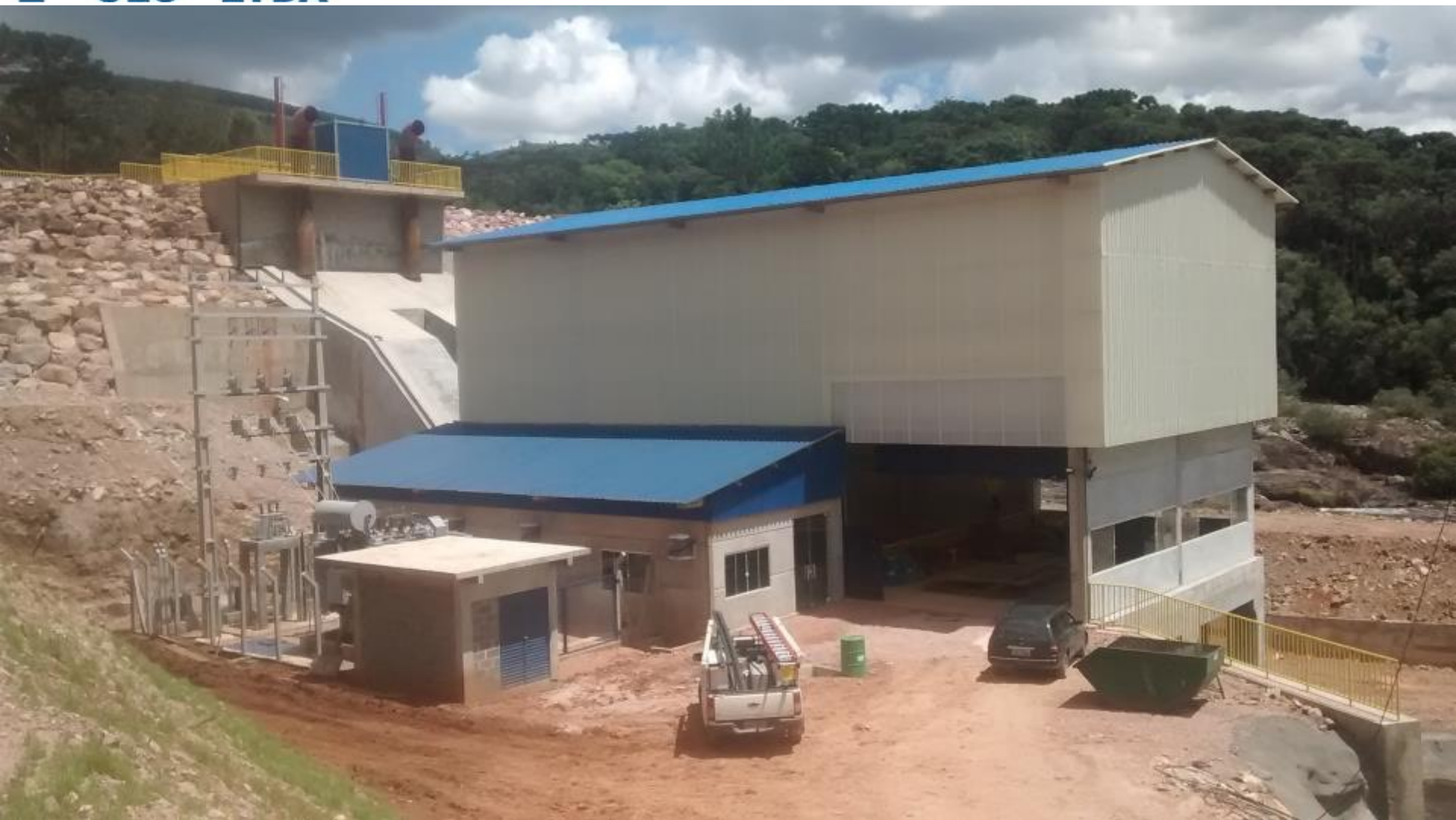
VISTA DA CASA DE FORÇA/SE/CÂMARA DE CARGA