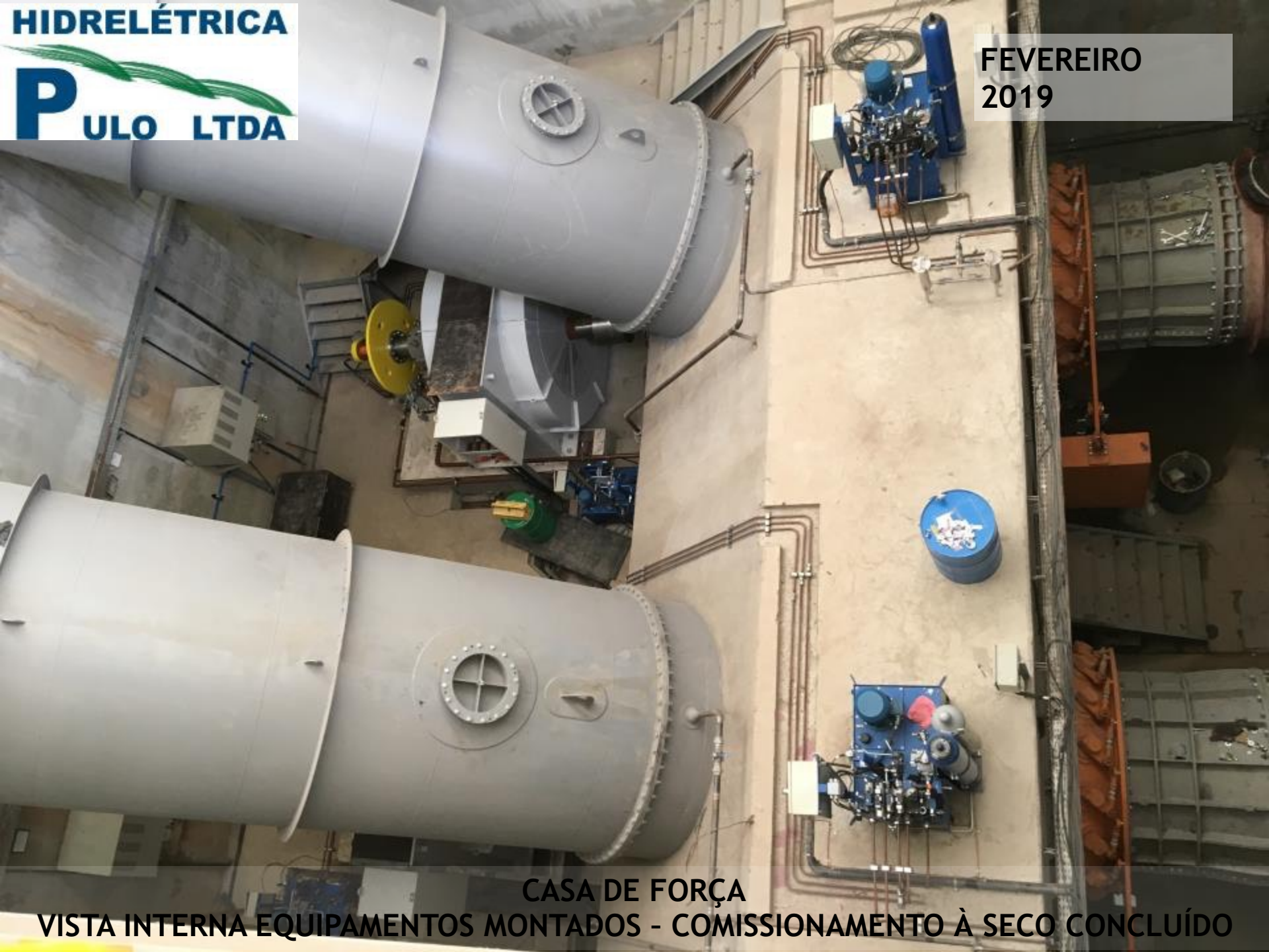
CASA DE FORÇA VISTA INTERNA EQUIPAMENTOS MONTADOS - COMISSONAMENTO À SECO CONCLUÍDO