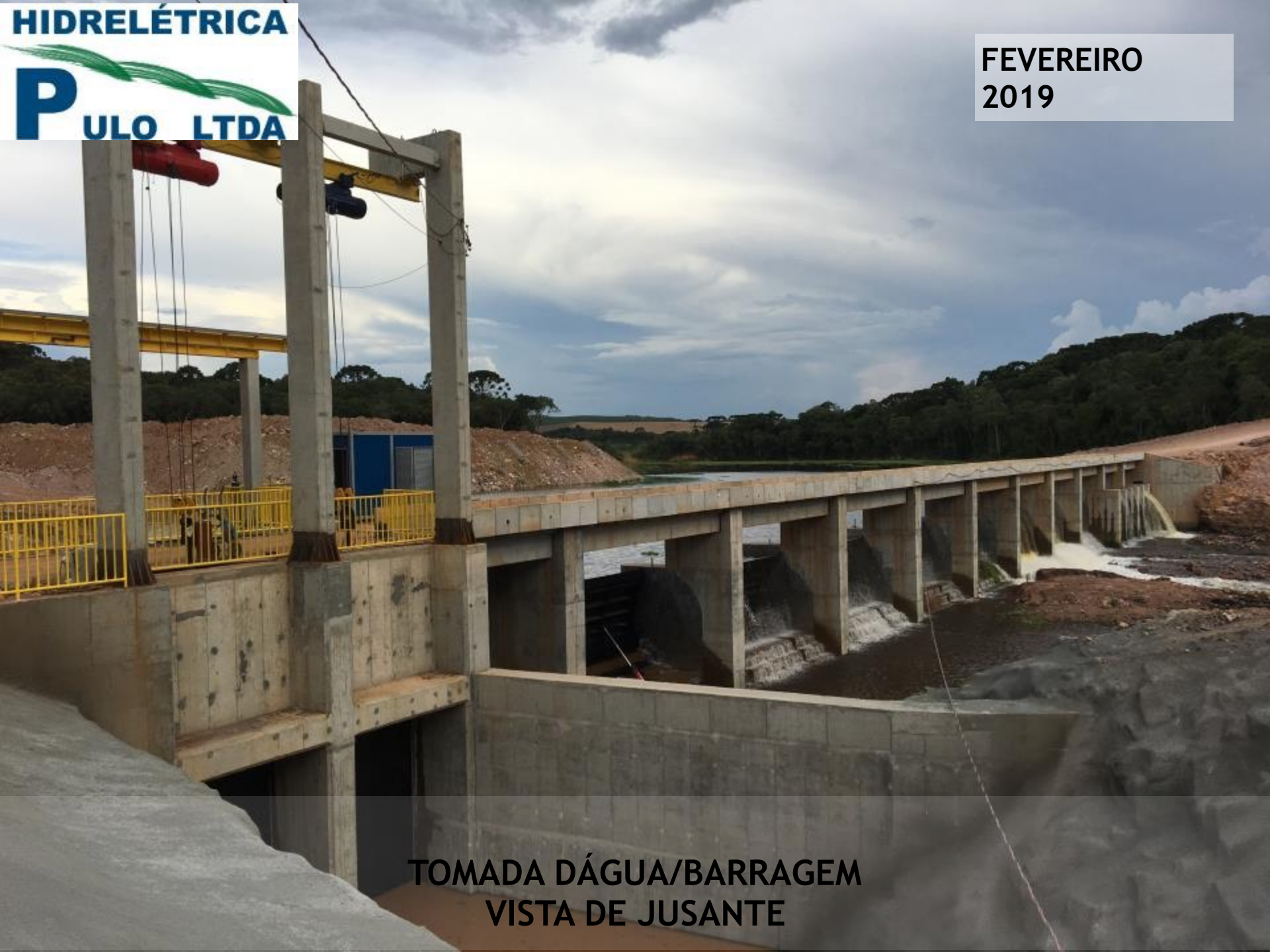
TOMADA D'ÁGUA/BARRAGEM VISTA DE JUSANTE