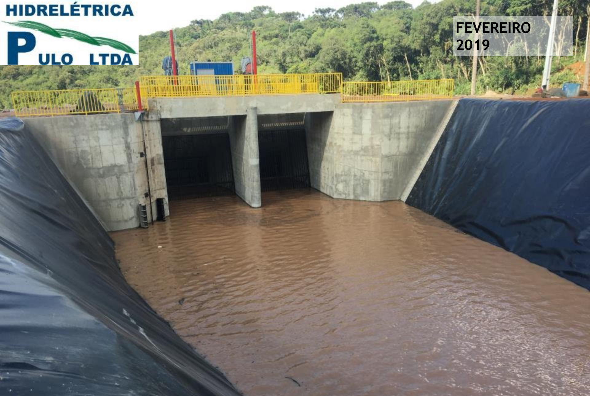
CÂMARA DE CARGA DURANTE ENCHIMENTO DO CANAL