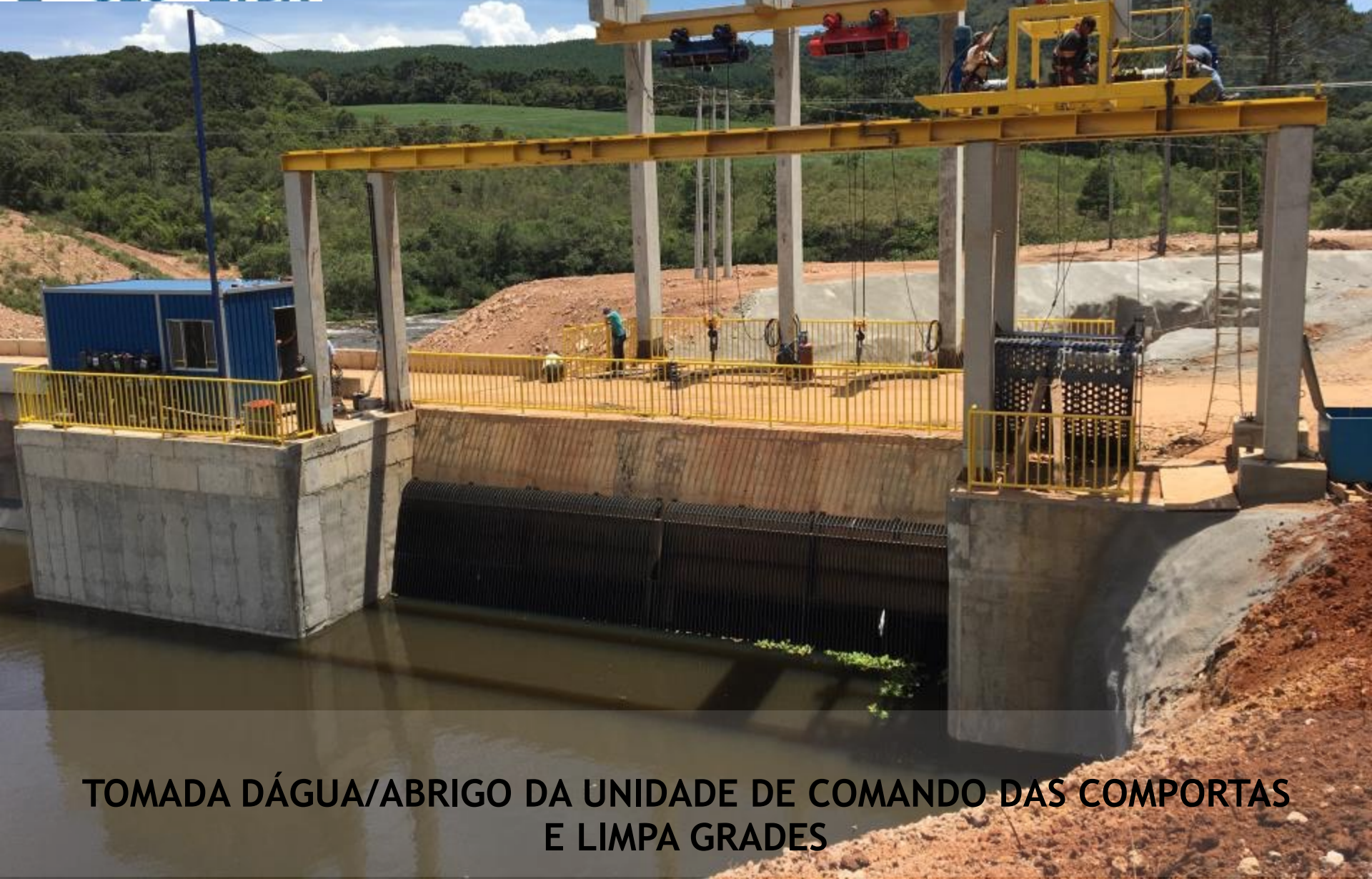
TOMADA D'ÁGUA/ABRIGO DA UNIDADE DE COMANDO DAS COMPORTAS E LIMPA GRADES