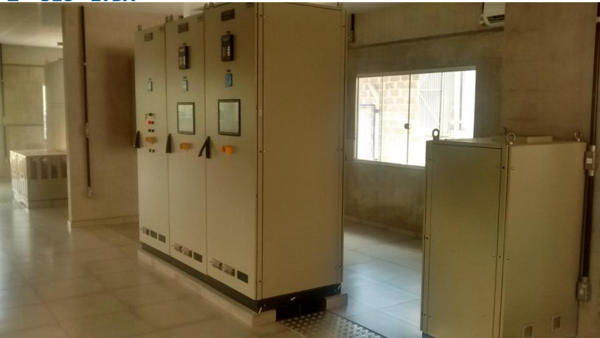
SALA DE COMANDO VISTA INTERNA