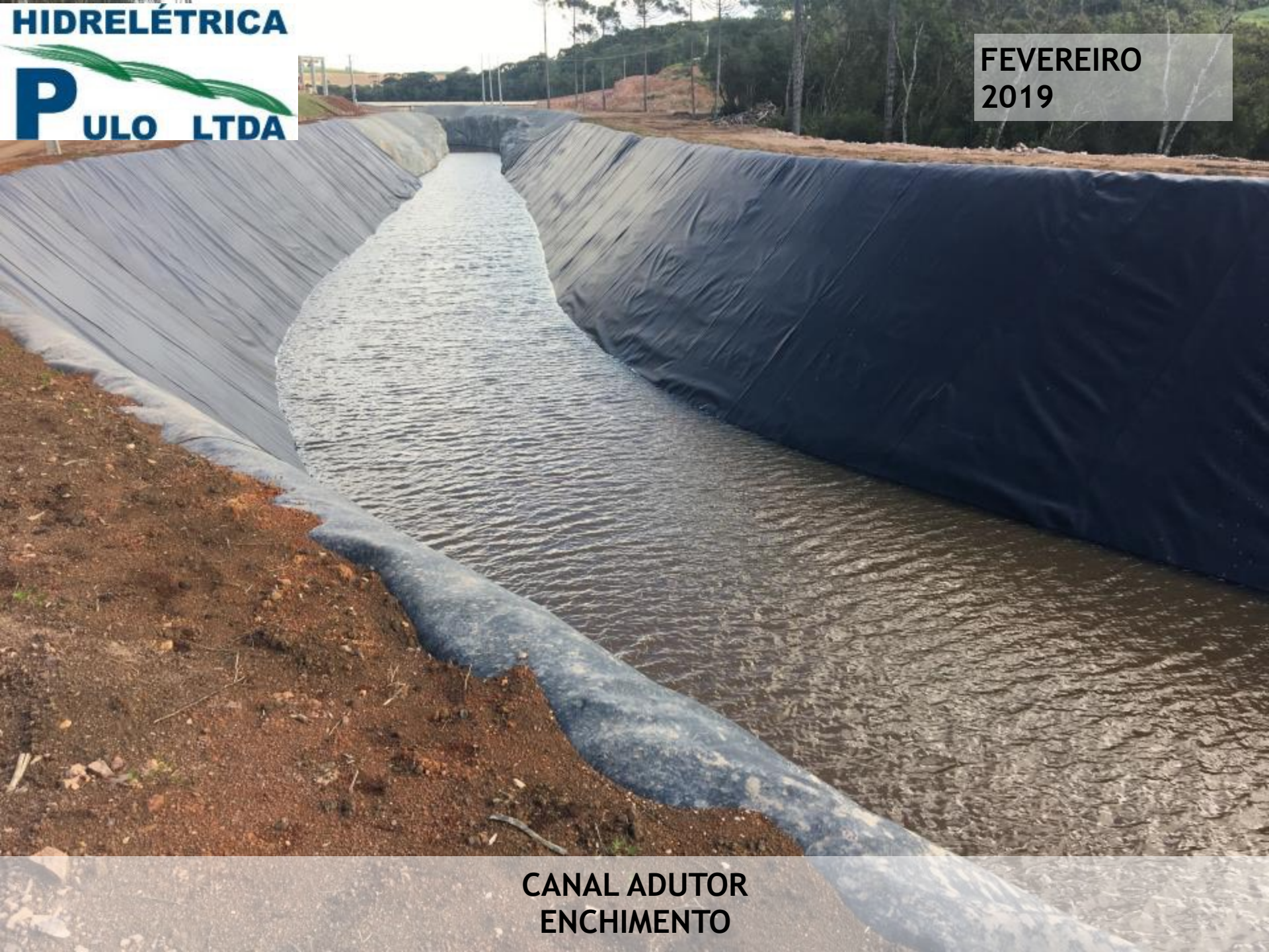
CANAL ADUTOR ENCHIMENTO