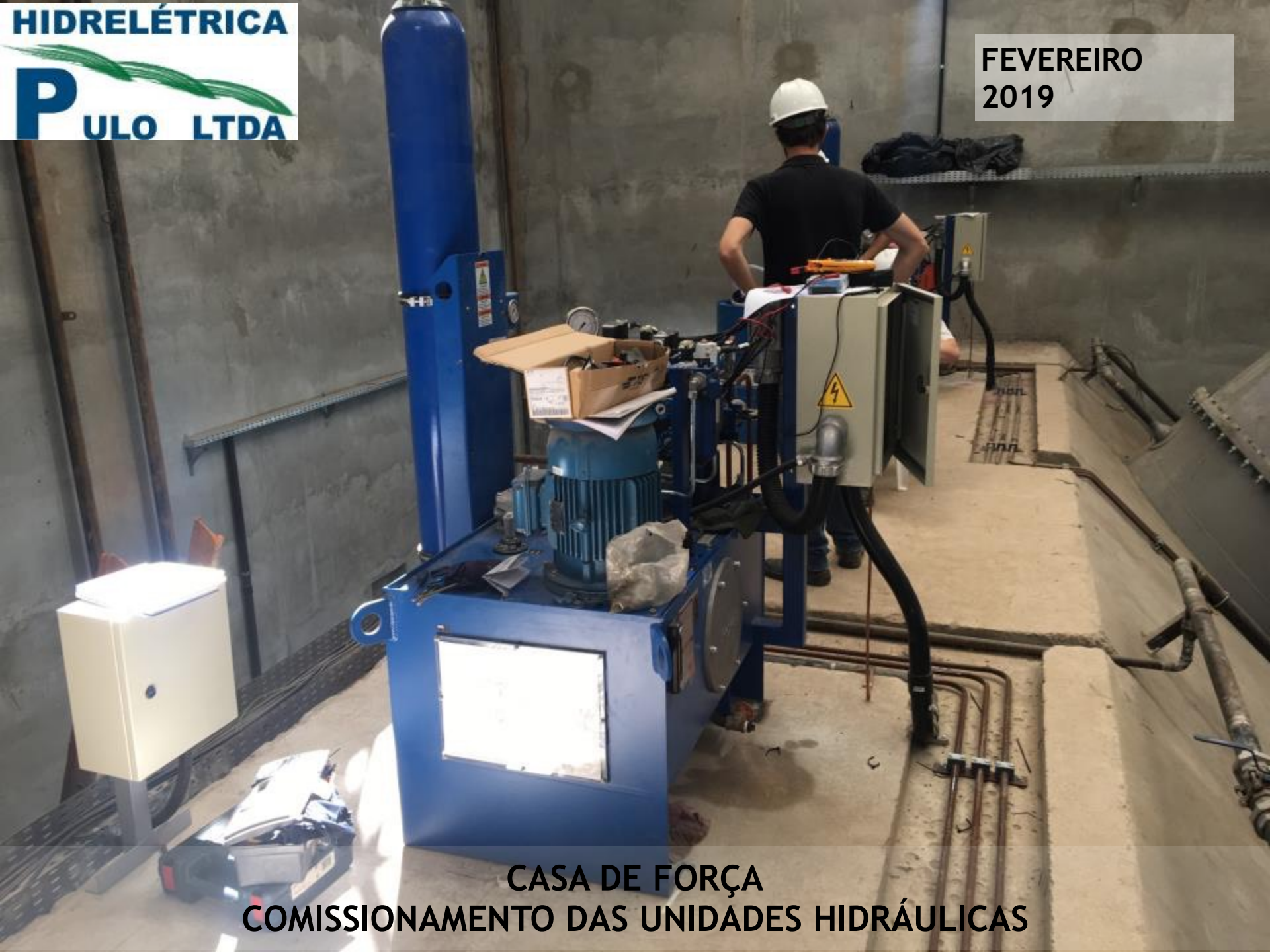
CASA DE FORÇA COMISSONAMENTO DAS UNIDADES HIDRÁULICAS