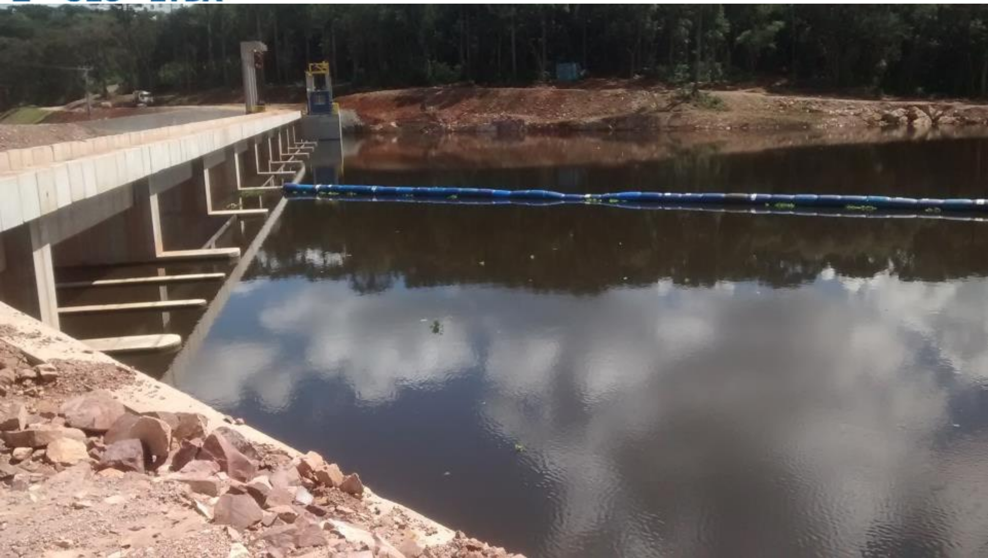
BARRAGEM LOGBOOM INSTALADO