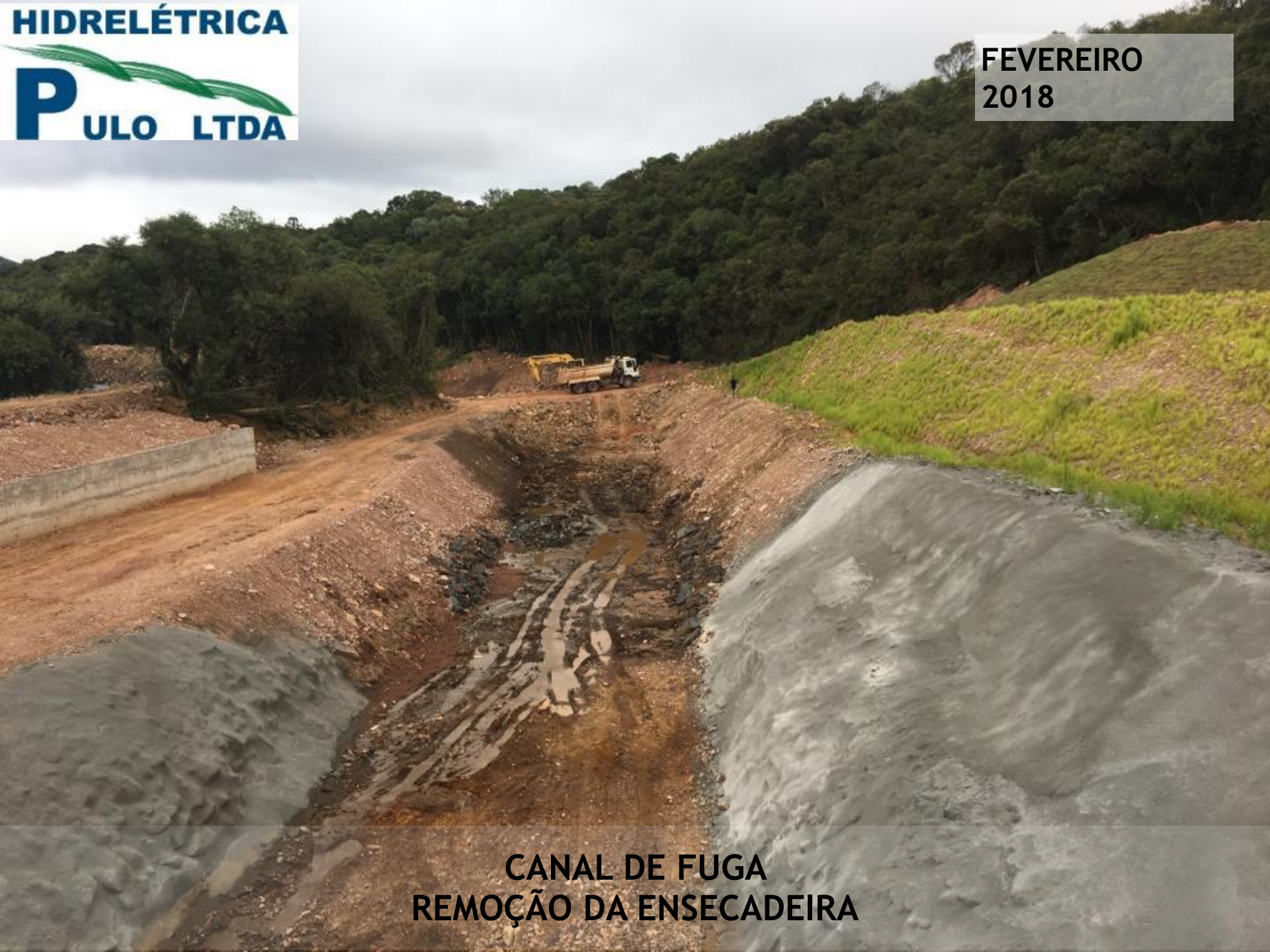
CANAL DE FUGA REMOÇÃO DA ENSECADORA