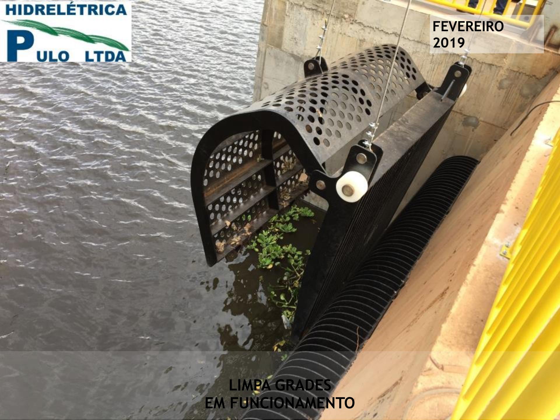
LIMPA GRADES EM FUNCIONAMENTO