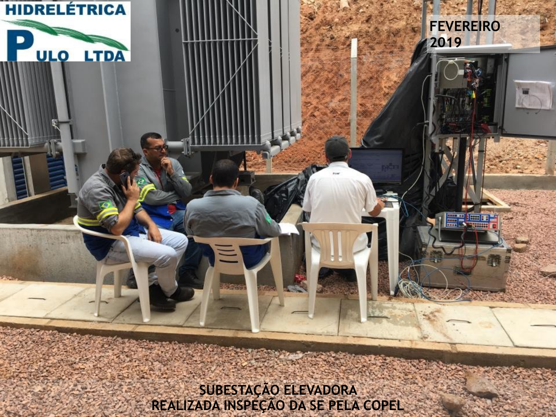
SUBESTAÇÃO ELEVADORA REALIZADA INSPEÇÃO DA SE PELA COPEL