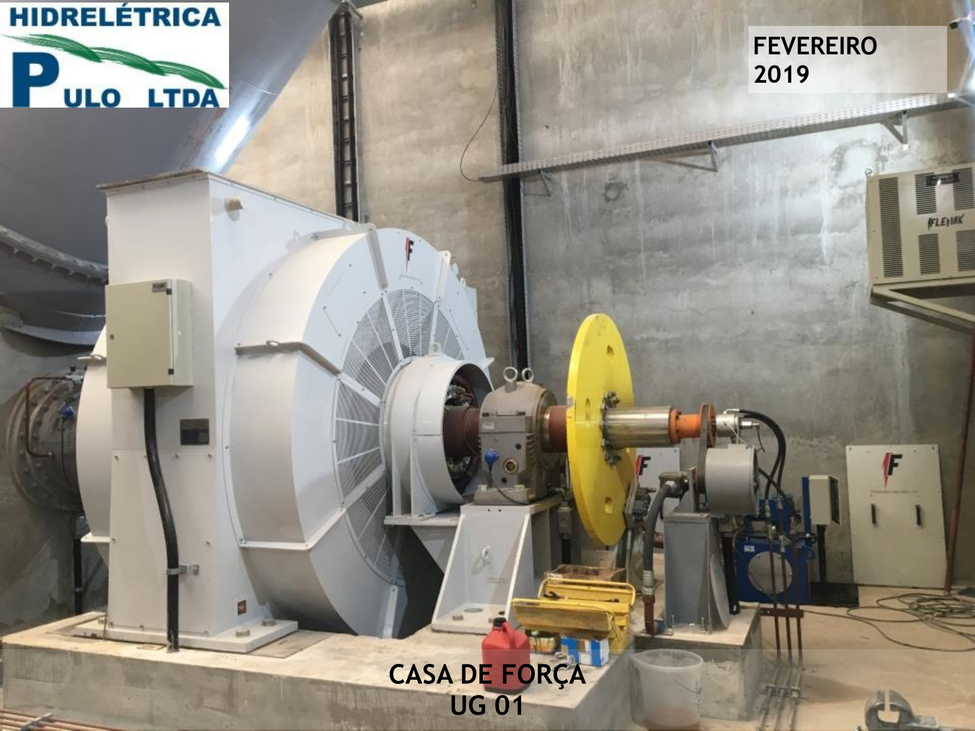
CASA DE FORÇA UG 01