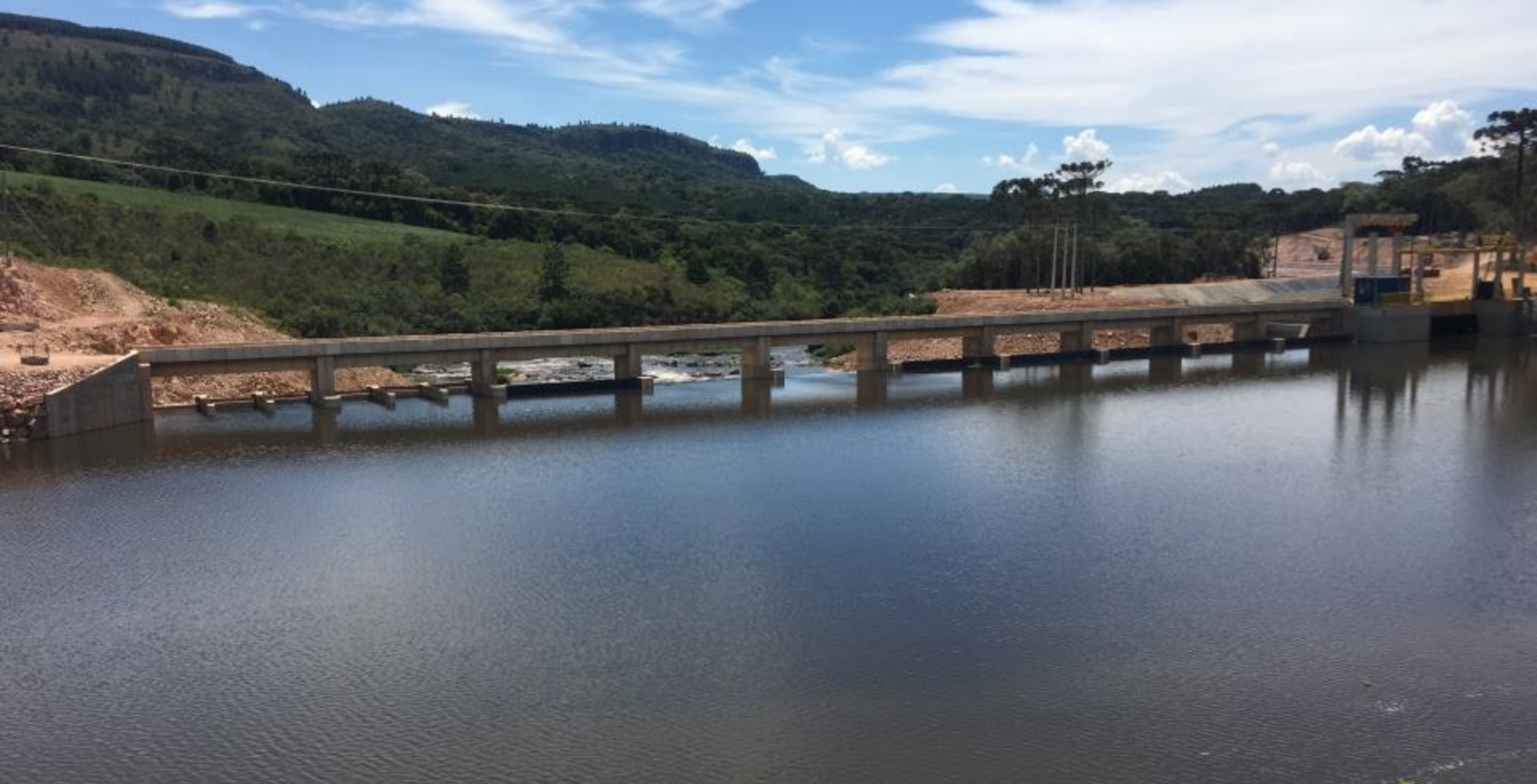
BARRAGEM VISTA DE MONTANTE DO LAGO