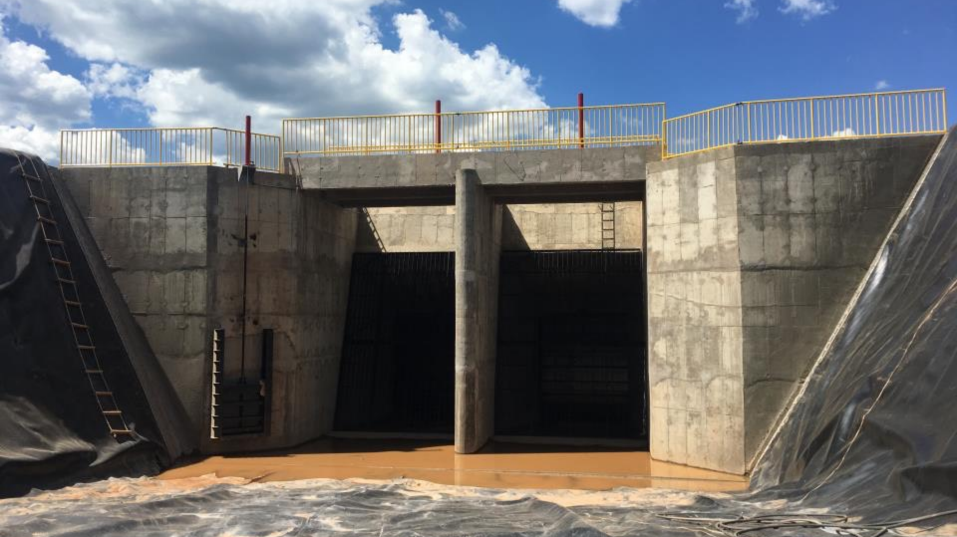
CANAL ADUTOR/CÂMARA DE CARGA ANTES ENCHIMENTO DO CANAL