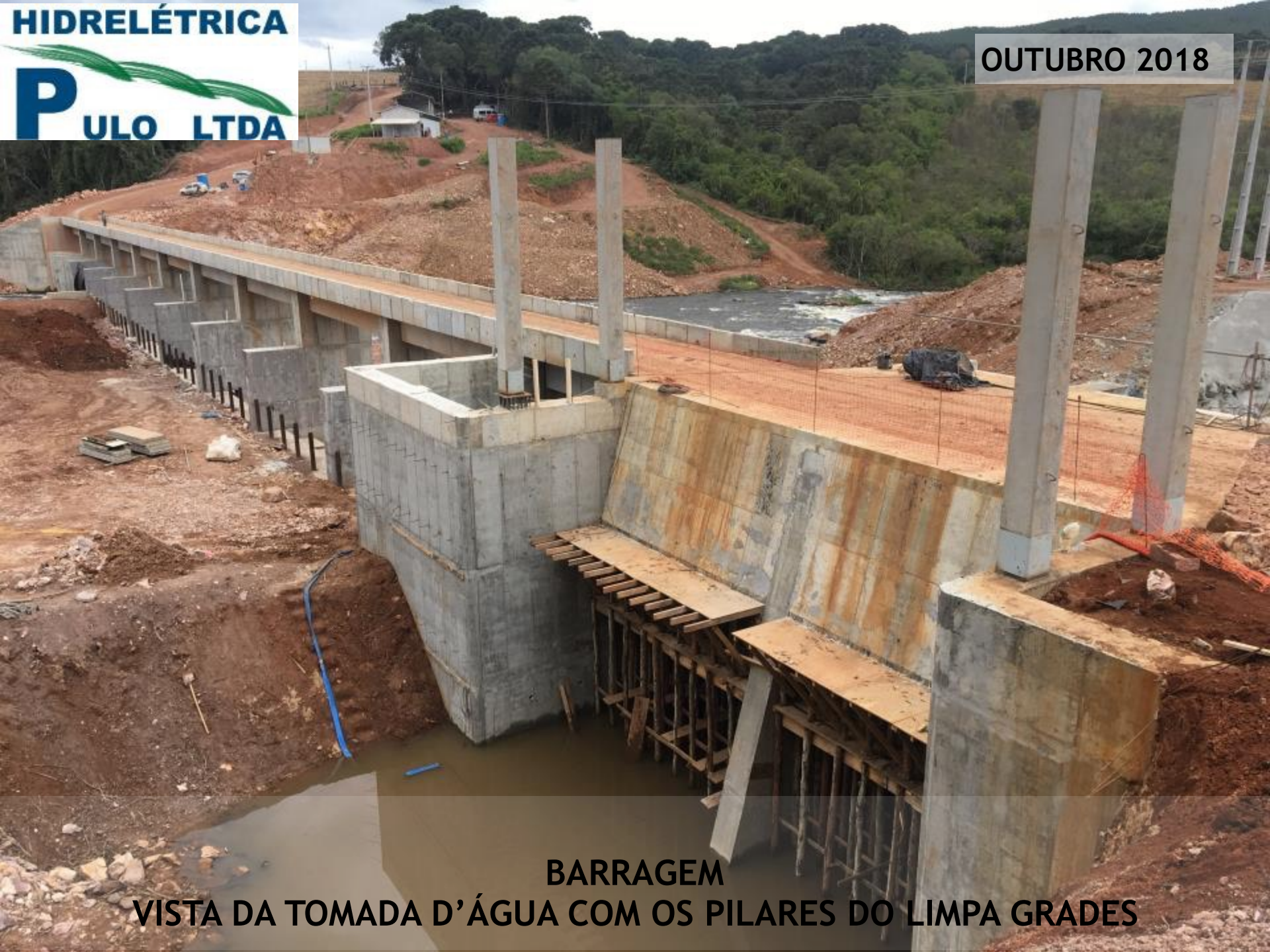
BARRAGEM VISTA DA TOMADA D'ÁGUA COM OS PILARES DO LIMPA GRADES