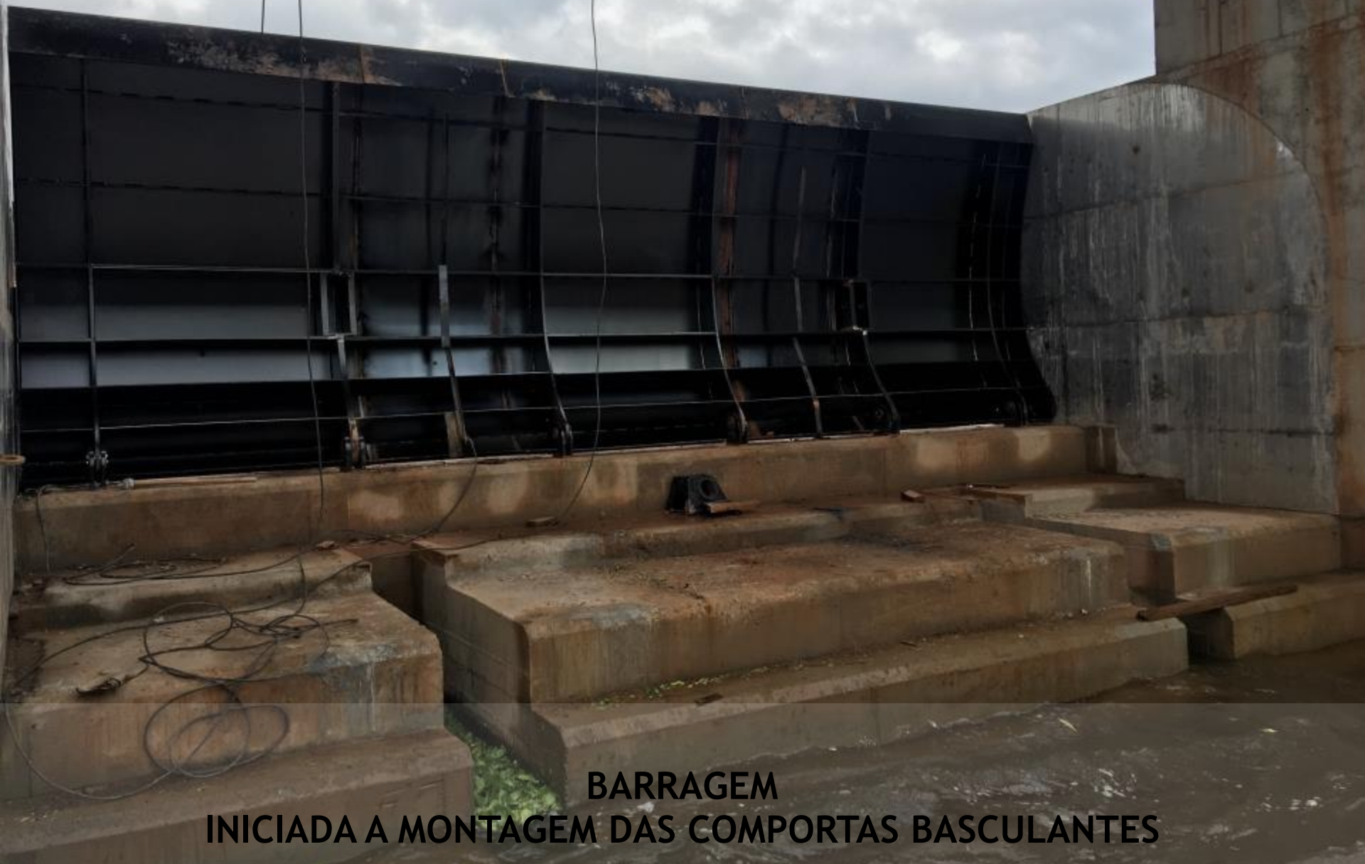
BARRAGEM INICIADA A MONTAGEM DAS COMPORTAS BASCULANTES