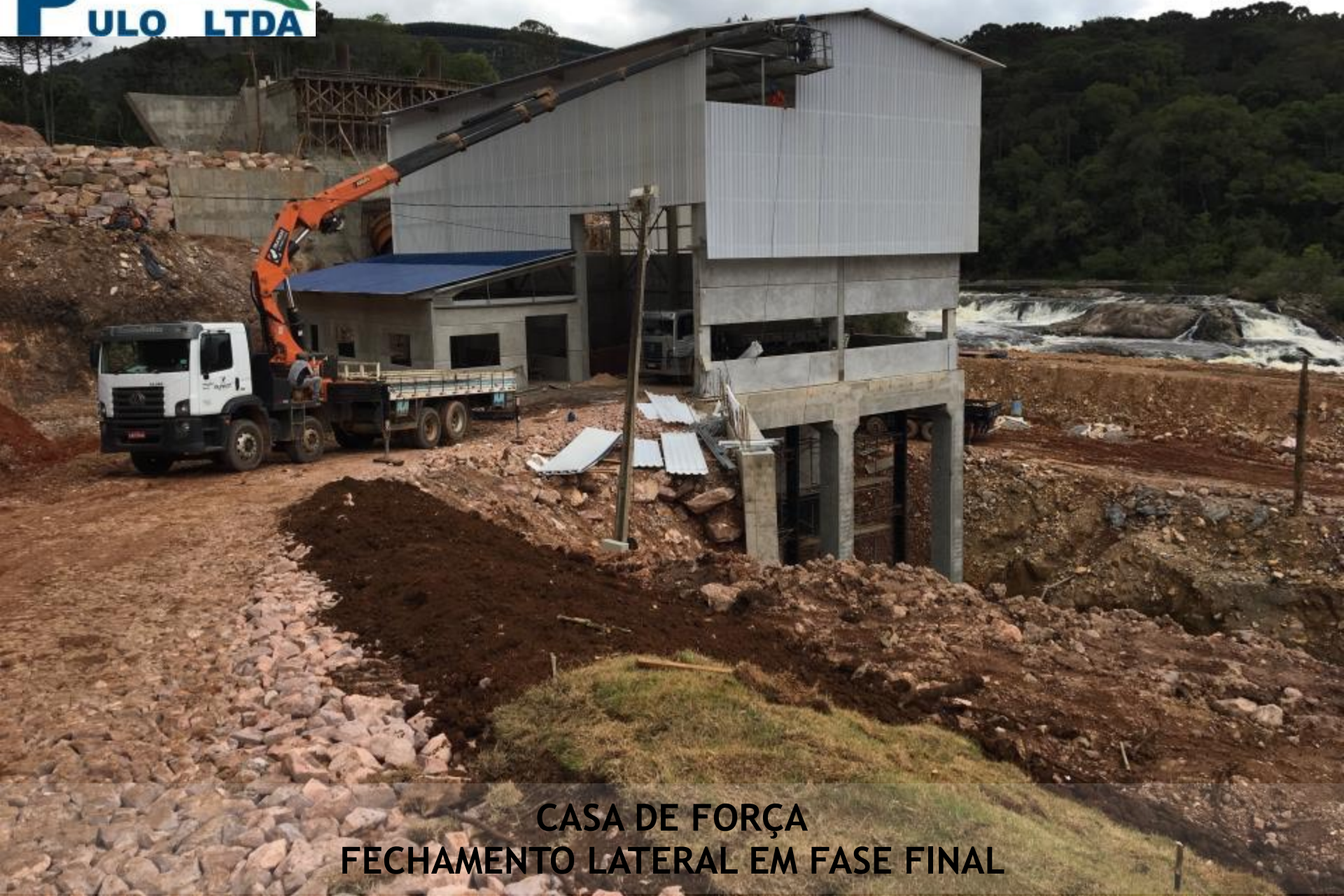
CASA DE FORÇA FECHAMENTO LATERAL EM FASE FINAL