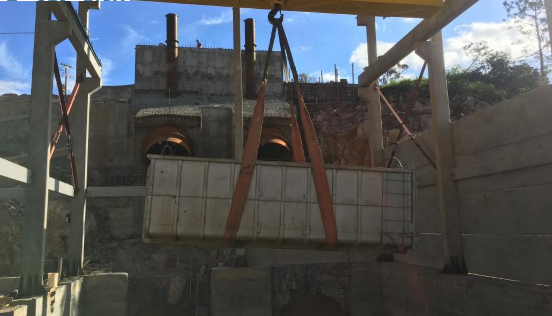
CASA DE FORÇA COMISSONAMENTO DA PONTE ROLANTE