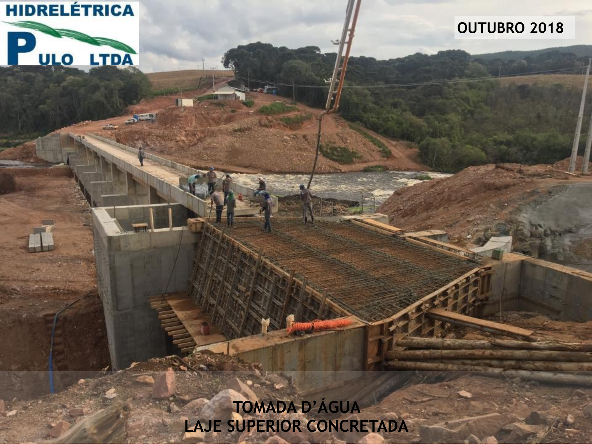
TOMADA D'ÁGUA LAJE SUPERIOR CONCRETADA