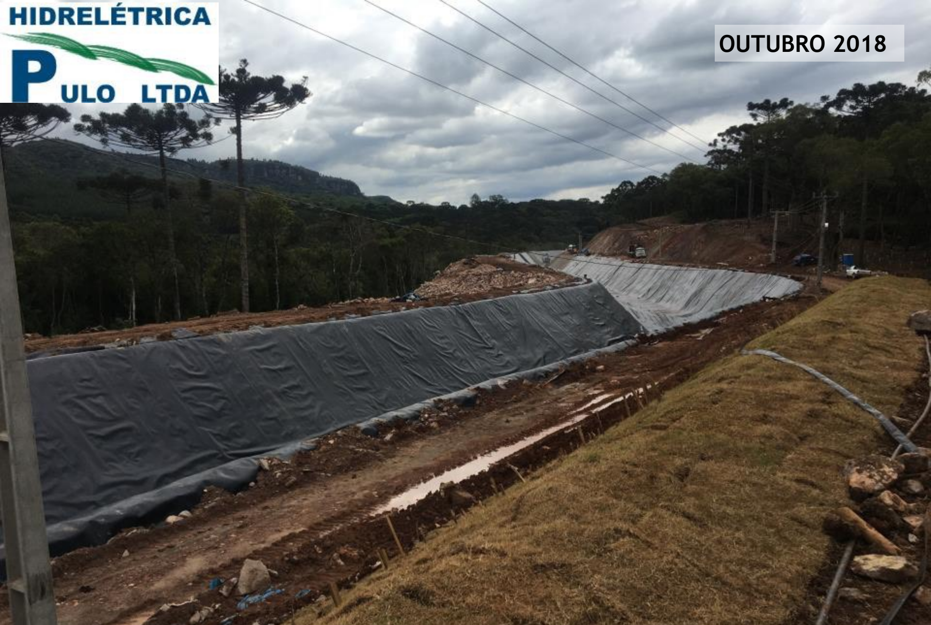
CANAL ADUTOR REVESTIMENTO E PLANTIO DE GRAMA NOS TALUDES