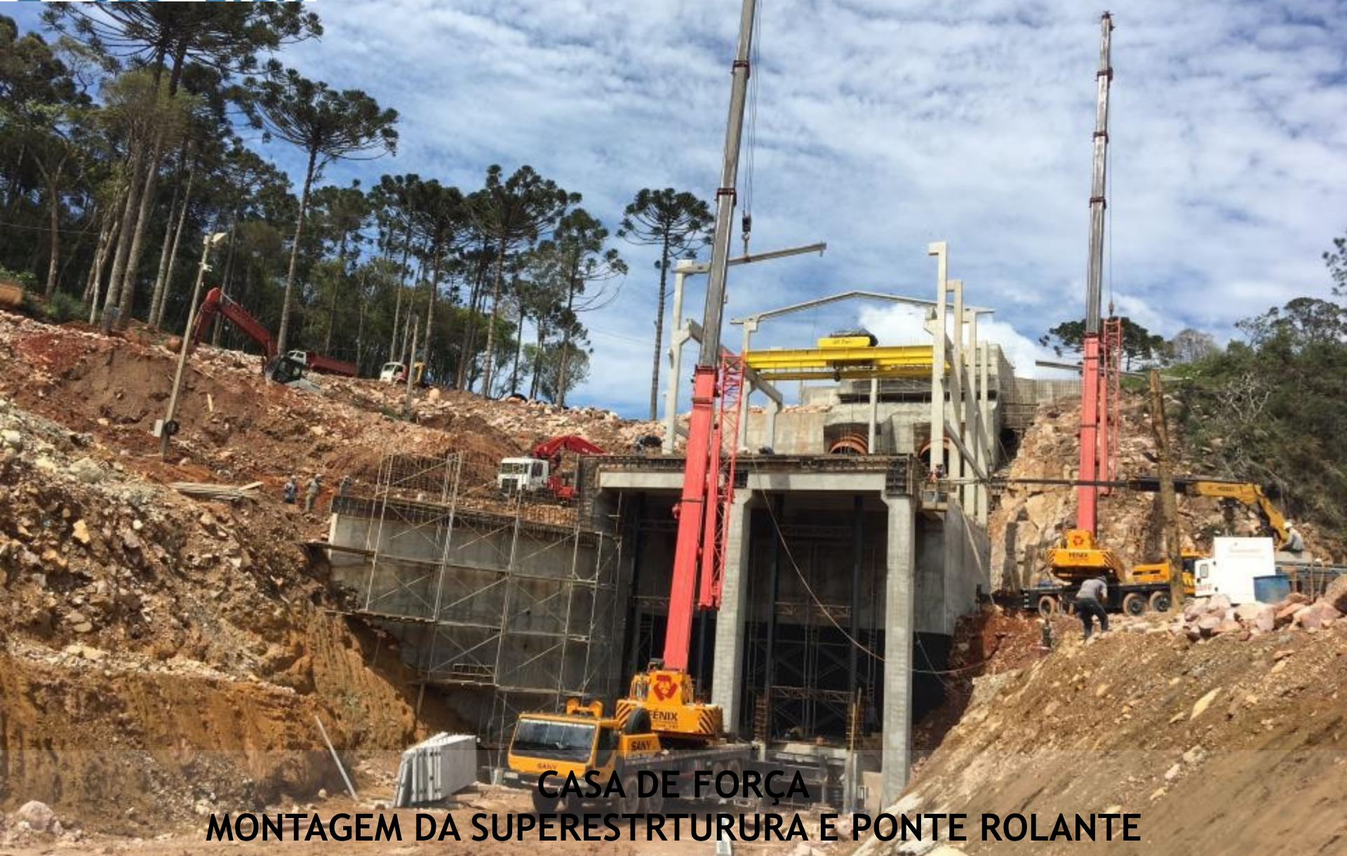
CASA DE FORÇA MONTAGEM DA SUPERESTRUTURA E PONTE ROLANTE