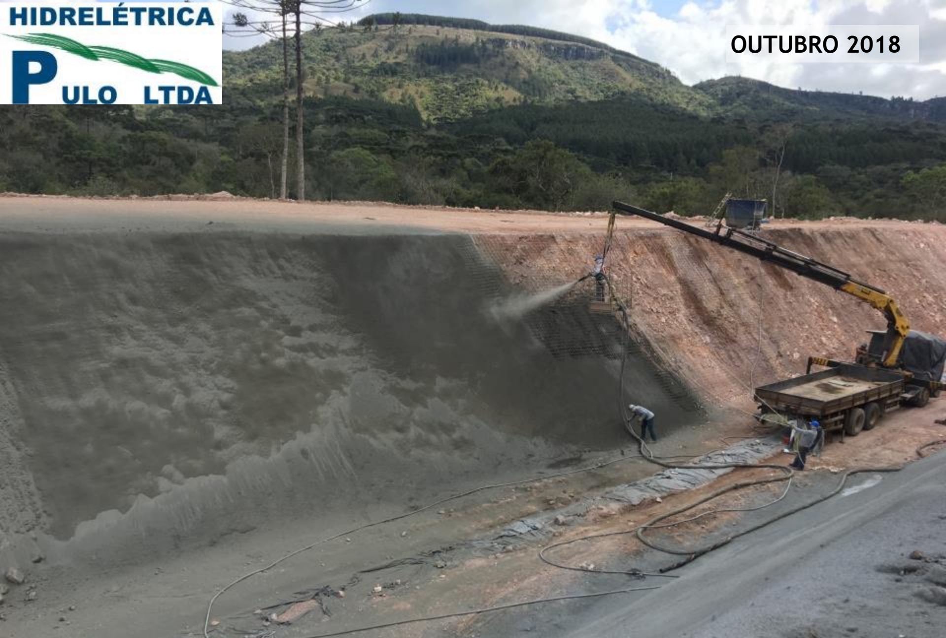
CANAL ADUTOR CONCRETO PROJETADO ENTRE ESTACAS 18 A 20