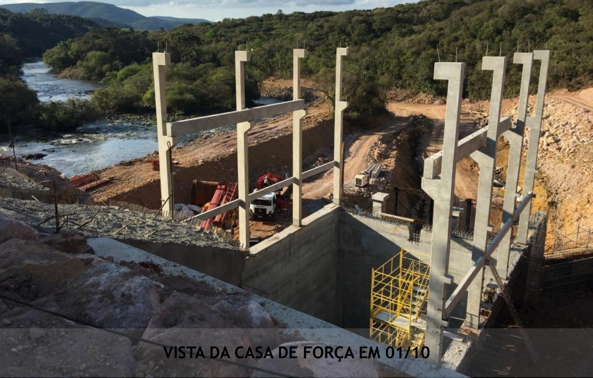
VISTA DA CASA DE FORÇA EM 01/10