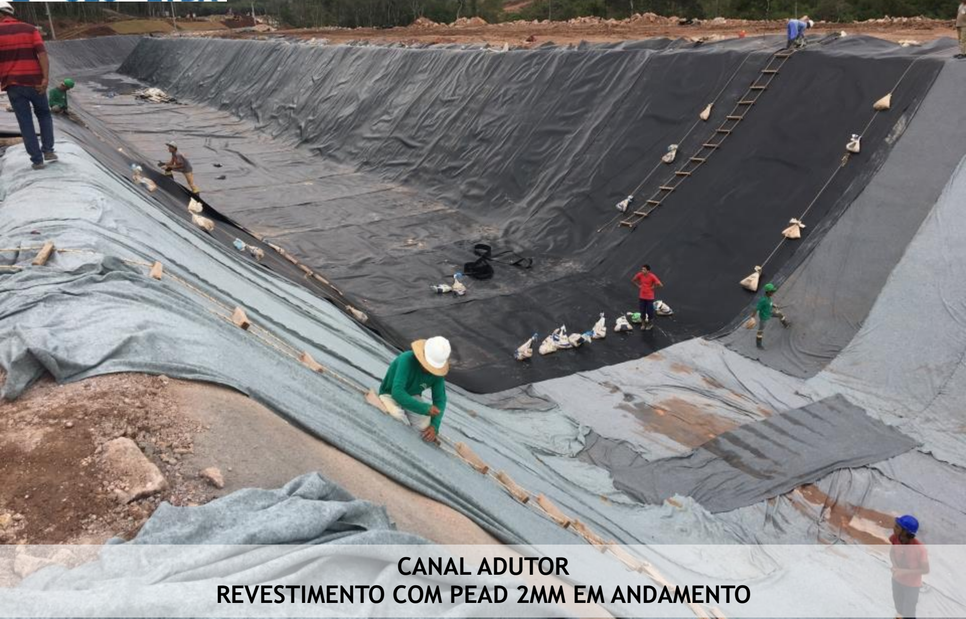
CANAL ADUTOR REVESTIMENTO COM PEAD 2MM EM ANDAMENTO