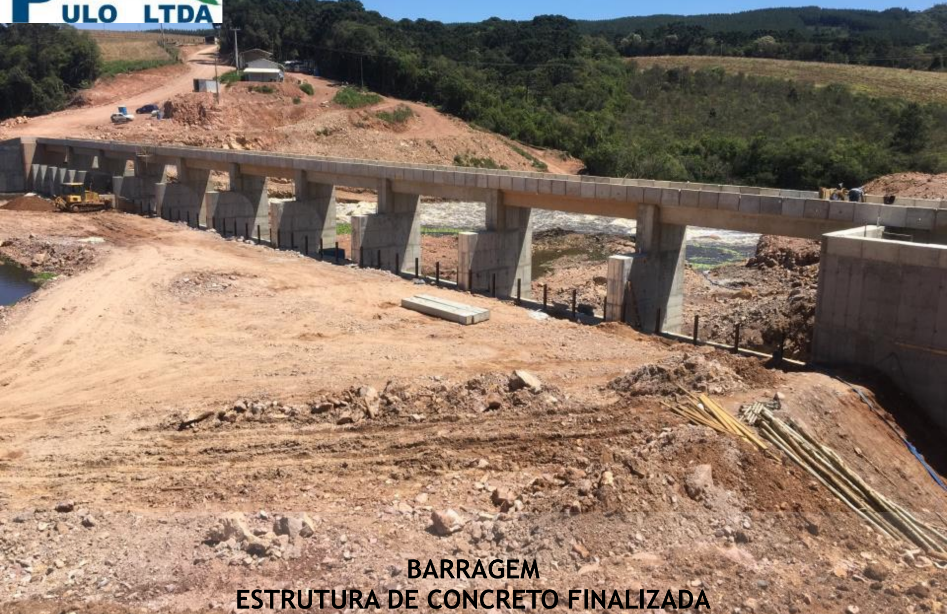
BARRAGEM ESTRUTURA DE CONCRETO FINALIZADA