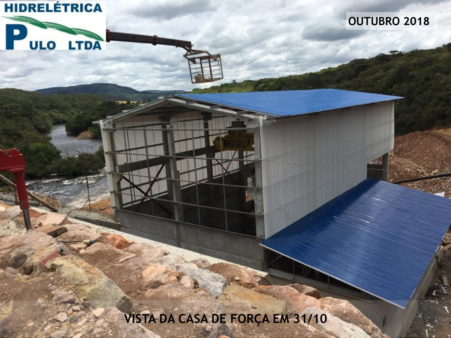
VISTA DA CASA DE FORÇA EM 31/10