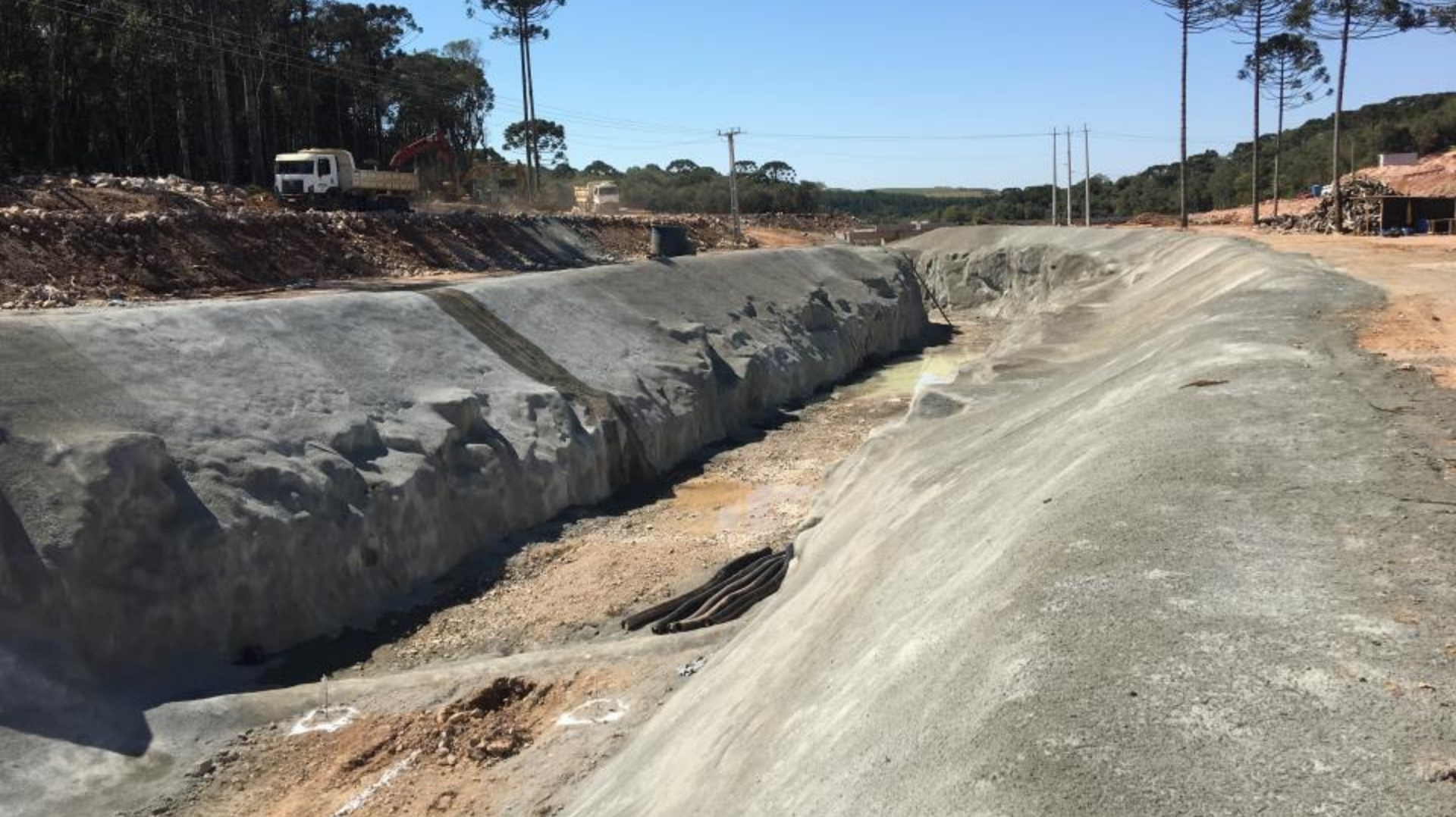
CANAL ADUTOR TRECHO EM ROCHA ENTRE ESTACAS 0 A 10 TRATAMENTO EM CONCRETO PROJETADO FINALIZADO