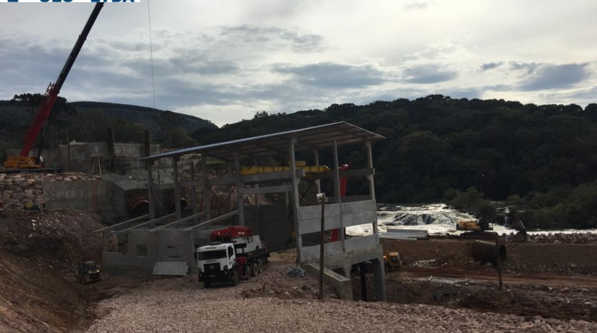
CASA DE FORÇA EM EXECUÇÃO FECHAMENTOS LATERAIS E ESTRUTURA PRÉ-FABRICADA DA SALA DE COMANDO/ ACESSO DEFINITIVO