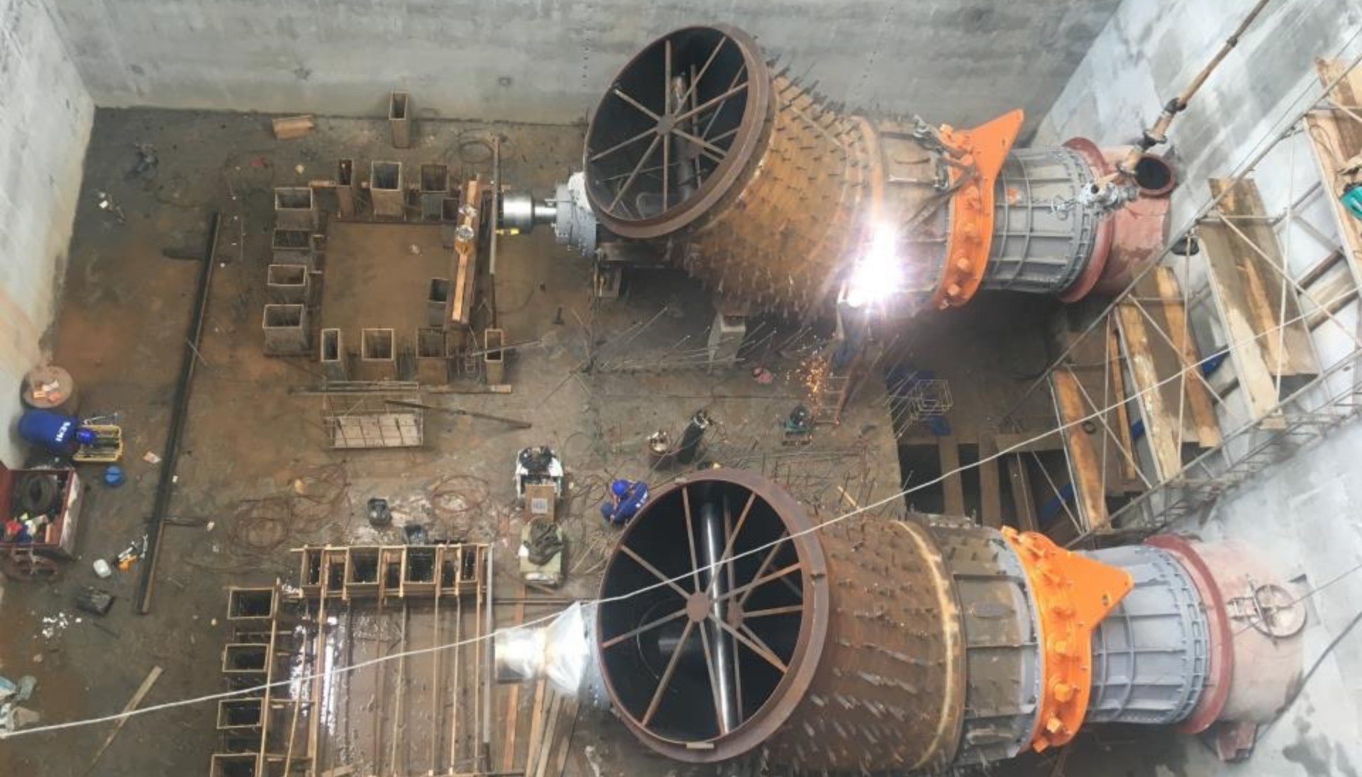
CASA DE FORÇA MONTAGENS EM ANDAMENTO M1 E M2