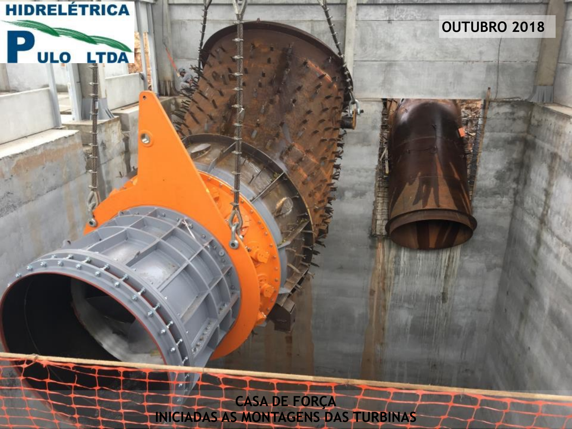
CASA DE FORÇA INICIADAS AS MONTAGENS DAS TURBINAS