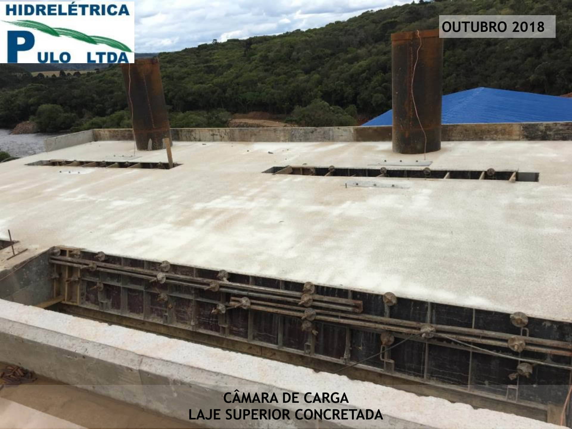
CÂMARA DE CARGA LAJE SUPERIOR CONCRETADA