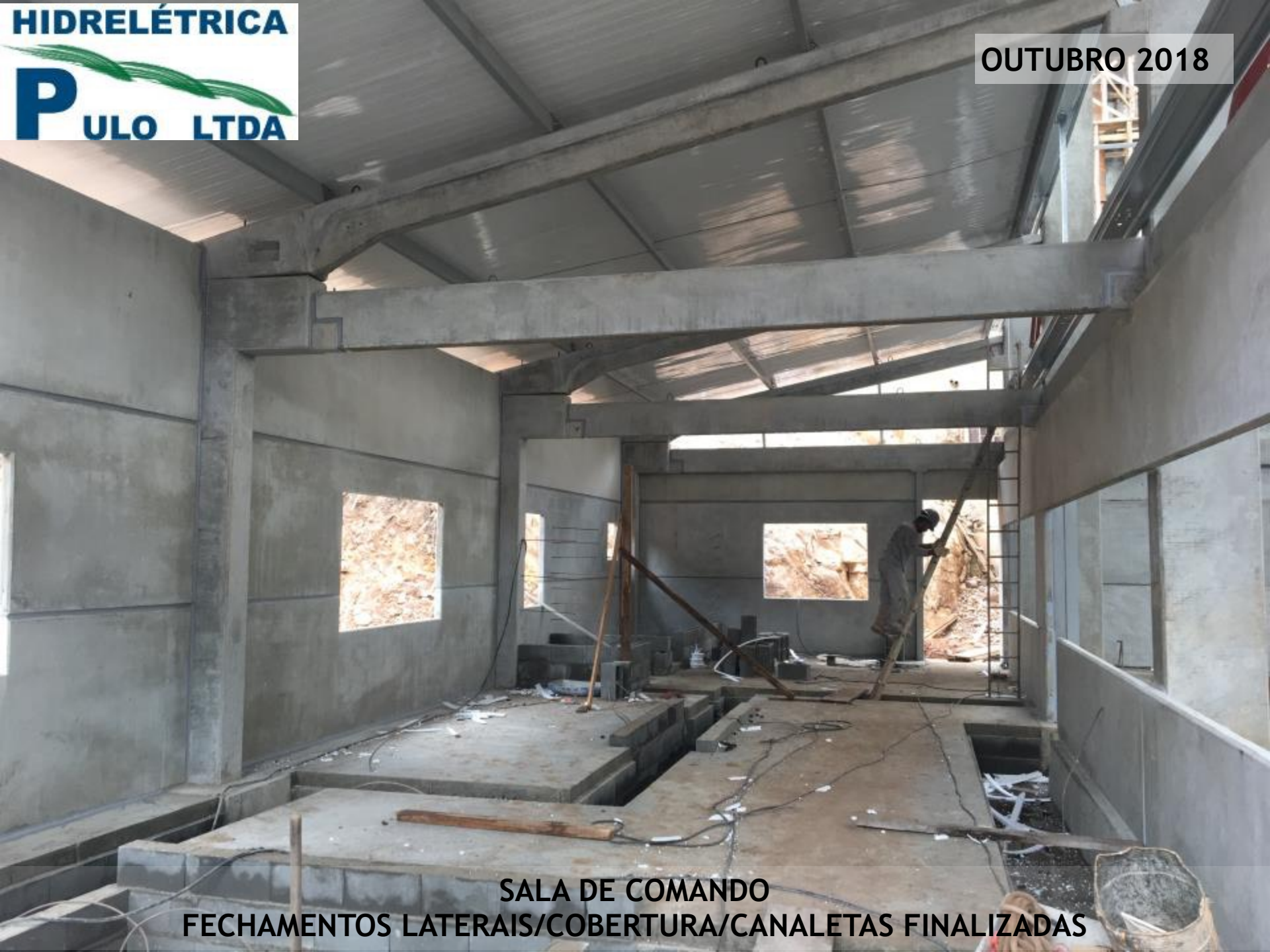
SALA DE COMANDO FECHAMENTOS LATERAIS/COBERTURA/CANALETAS FINALIZADAS