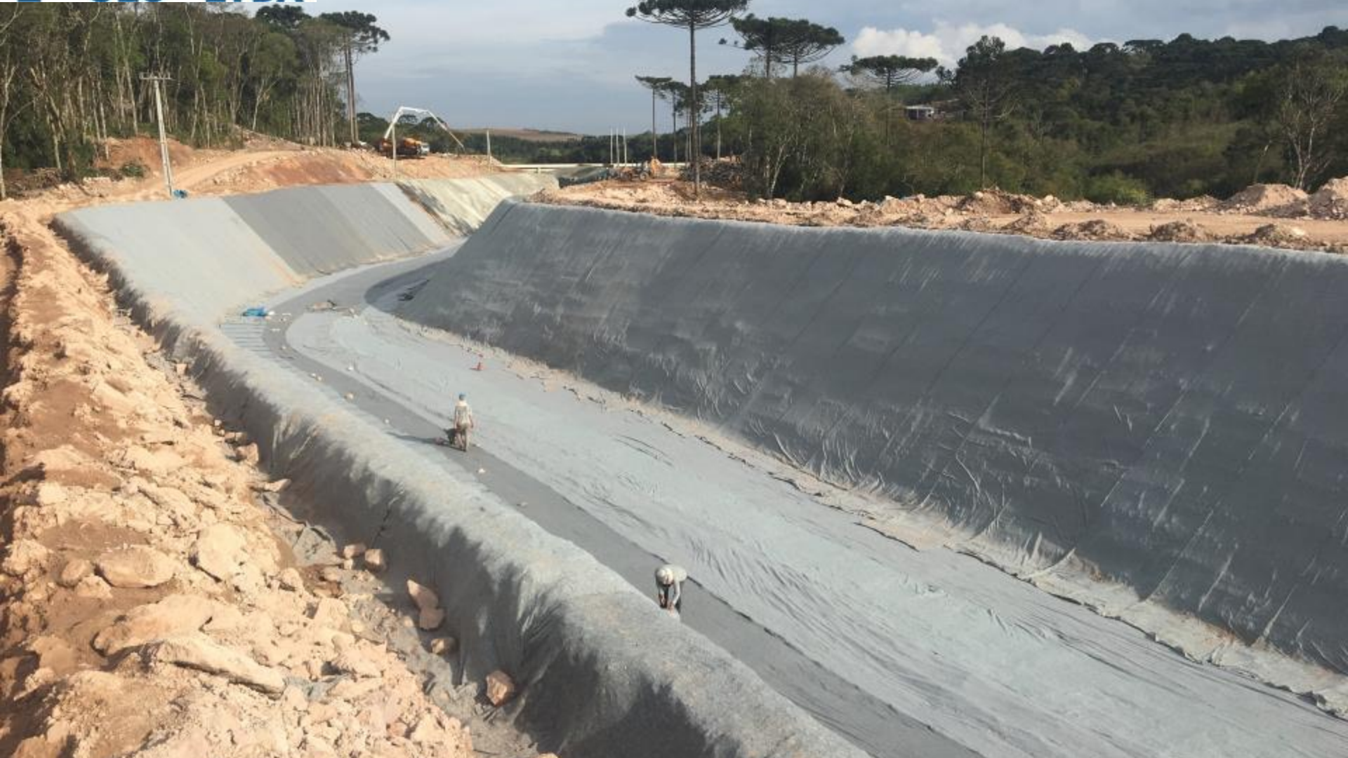
CANAL ADUTOR INICIADO O REVESTIMENTO DO CANAL COM BIDIM E POSTERIORMENTE PEAD 2MM